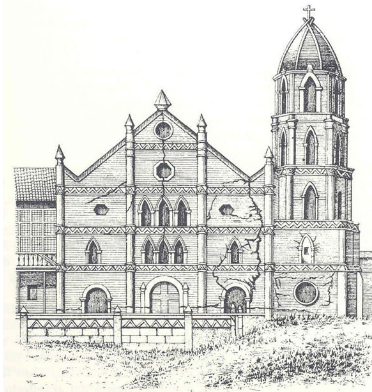
Figura 2. Efectos del terremoto de 1880 en la Iglesia de San Jacinto en Pangasinam (Filipinas). (Cerero, 1890).

Los efectos que los terremotos de 1880 produjeron en una Iglesia de la ciudad filipina de Pangasinam (figura 2), muestran como los diferentes periodos de oscilación de estructuras contiguas y de diferente rigidez pueden verse afectadas. Este comportamiento, ya aparee citado explícitamente en los documentos contemporáneos al suceso (Cerero, 1890).