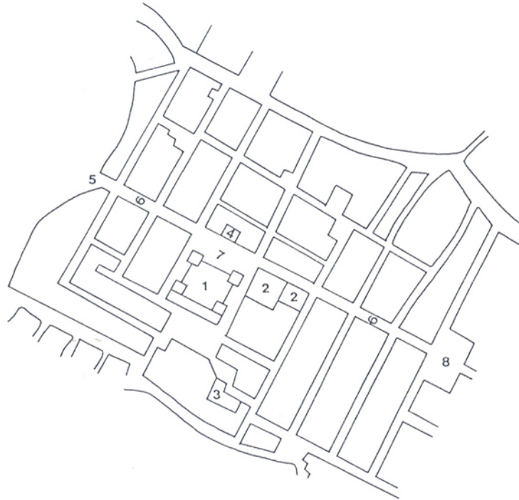
Figura 1. Esquema del trazado de la planificación urbana de la ciudad de Vera tras el terremoto de 1518 (Villanueva Muñoz, 1986).

terremoto ocurrido en 1518 que destruyó la ciudad de Vera, en la provincia española de Almería. Como consecuencia de la catástrofe, la ciudad quedó reducida a escombros, planteándose la necesidad de trasladarla a un lugar más adecuado, ya que dado su carácter medieval, y también como elemento defensivo, estaba ubicada en una colina, por lo que se planificó su traslado hasta un emplazamiento llano, de acuerdo con la tendencia general de la época para configurar las ciudades modernas. También la desaparición de la fuente que suministraba agua o la gran cantidad de escombros acumulados y la poca solidez del terreno, aconsejó su traslado. Un informe sobre cómo se debería reedificar la ciudad indicaba que debía tener un trazado regular, configurándose alrededor de una calle principal, una serie de secundarias y bordeada por un perímetro defensivo (figura 1).